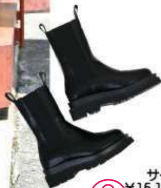
HUMS Z230632 サイドゴアブーツ ¥15,180 (8月上旬予定)