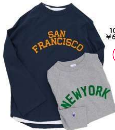
champion CW-Y404 10分袖ロゴカットソー ¥6.050 (8月下旬予定)