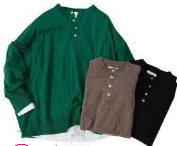
hagumu 125627 ハイゲージ ヘンリーネックニット ¥6.490 (9月中旬予定)