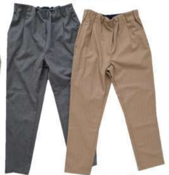
ANTGAUGE C2135 タックトラウザー テーパードパンツ ¥15,950 (入荷中)