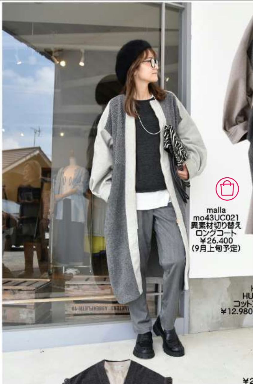
malla mo43UC021 異素材切り替え ロングコート ¥26,400 (9月上旬予定)