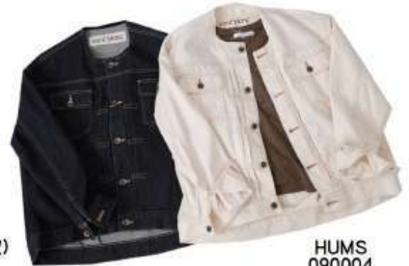
VENTBLANC VBJ213364 デニムジャケット ¥28.380 (8月上旬予定)