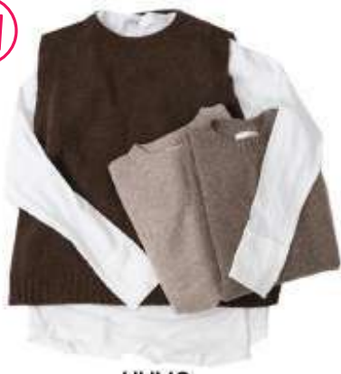
HUMS 141012 ニットベスト ¥8.690 (9月上旬予定)