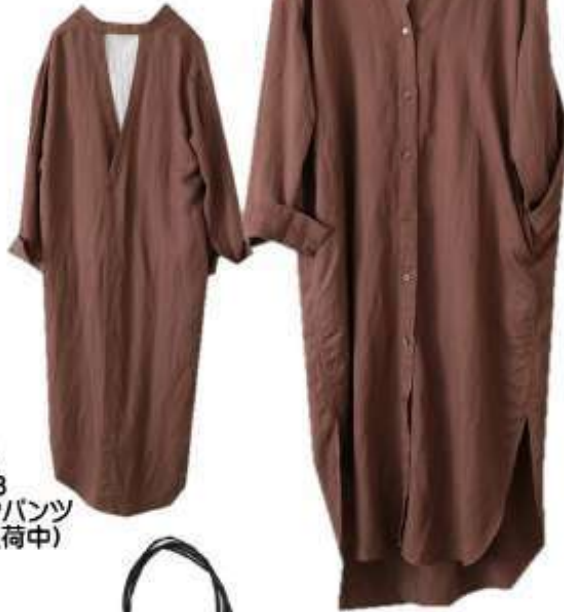
HUMS 141026 バックデザイン シャツコート ¥15.180 (9月上旬予定) backstyle