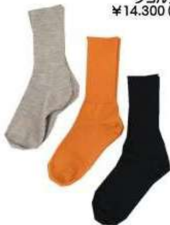
enLife EL19407a ソックス ¥2.420 (9月上旬予定)