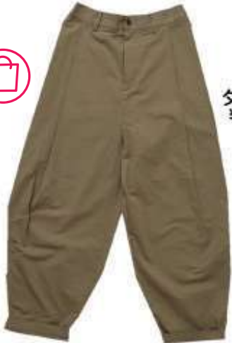
BEAURE B-22434 ゼブラート ¥12.100 (入荷中)