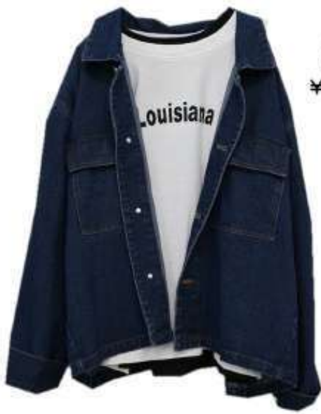
INTHEMARKET C-2192 バックジップデザイン Gジャン ¥10.780 (9月上旬予定)