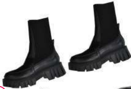
libero L24032 サイドゴアブーツ ¥16.280 (9月上旬予定)