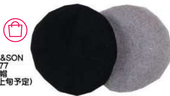
STEVENS&SON 333-077 ベレー帽 ¥4.290 (8月上旬予定)