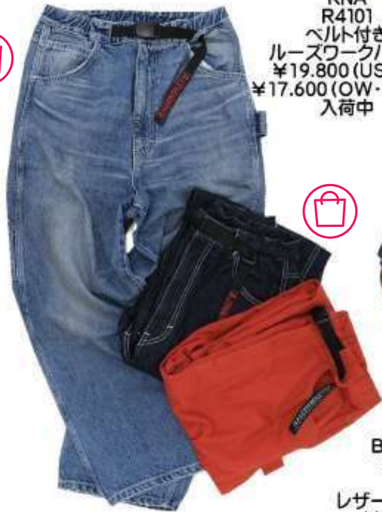
RNA R4101 ベルト付き ルーズワークパンツ ¥19.800 (USED) ¥17.600 (OW・カラー) 入荷中