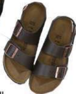
BIRKENSTOCK 34193 (BLK) 34103 (BR) レザーベルト付きサンダル ¥16.500 (入荷中)